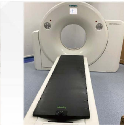
Siemens SOMATOM Scope方案