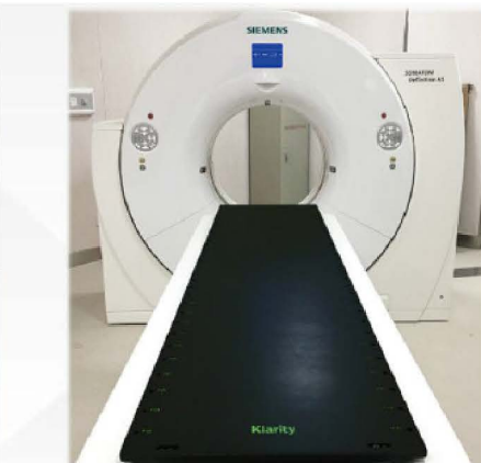
Siemens SOMATOM Definition Edge方案